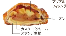
アップル フィリング レーズン カスタードクリーム スポンジ生地