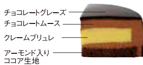
チョコレートグレイズ チョコレートムース クレームブリュレ アーモンド入り ココア生地