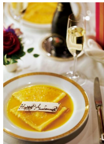
▲写真はイメージです