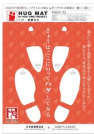
▲足型を配置したハグマット

1 月 31 日は I (アイ)31(サイ)の日。ホテルオークラ札幌(中央区南 1 西 5)では 1 月 27 日(土)~1 月 31 日(水)の期間中、館内 3 店舗のレストランにて「愛妻の日プラン」をご提供いたします。この日はご主人から奥さまへ、日頃はなかなか口に出せない感謝の気持ちを伝えてほしいという願いを込めて、各レストランの料理長が特別なディナーコースをご用意。そのほか「乾杯ドリンク」や嬉しい「プチギフト」に、「記念写真」「チューリップ(花言葉: 誠実な愛)」のプレゼント、足型に合わせて立つとハグが出来るユニークな「ハグマット」の贈呈など、様々な“愛妻家応援グッズ”をご用意し、各レストランにてお二人のための素敵なディナーを全力でサポートいたします。